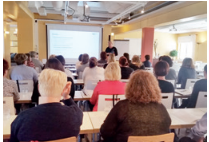
Kansallisen tulorekisterin käyttöönottoon liittyvä koulutus keräsi täyden salin Raumalla 9.5.