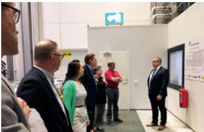
Kauppakamareiden kansanedustajatapaaminen toteutettiin keväällä Logistikas Oyn tiloissa.