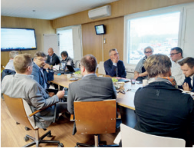
Kauppa- ja palvelualojen valiokunnan kokouksessa VMP-Interior Oy:llä 21.9. toteutettiin työpaja osaavan työvoiman saatavuuteen liittyen.