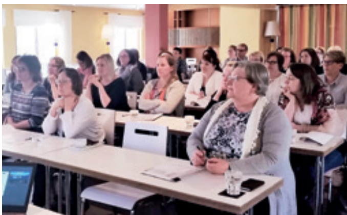
Toukokuussa toteutui Suuri Palkkapäivä, joka sai erinomaiset palautteet.

"Kouluttaja esitti aineiston mielenkiintoisesti. Aika kului nopeasti, vaikka aihe oli "tylsä"."