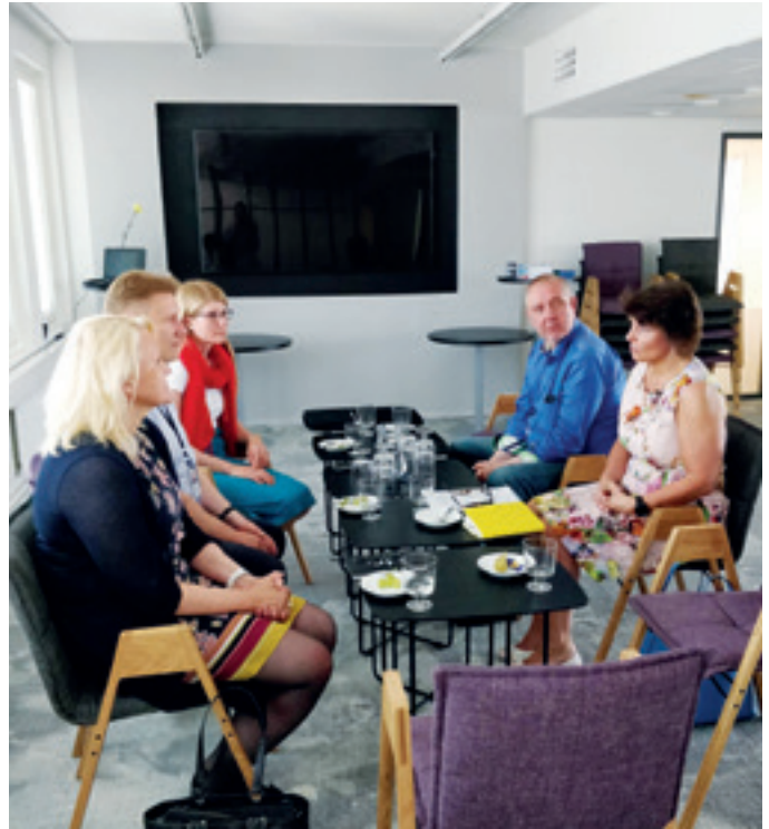
Liikenne- ja viestintäministeri Anne Berner Rauman ja Satakunnan kauppakamareiden vieraana SuomiAreena-viikolla.

VERKOSTOITUMINEN SEKÄ yksityisen ja julkisen sektorin välinen kumppanuus ovat avainasemassa tulosten aikaansaamisessa. Vaikuttaminen on entistä enemmän myös monikanavaista viestintää, joten jäsenlehti, tiedotteet ja sosiaalinen media tuovat ääntämme esille.